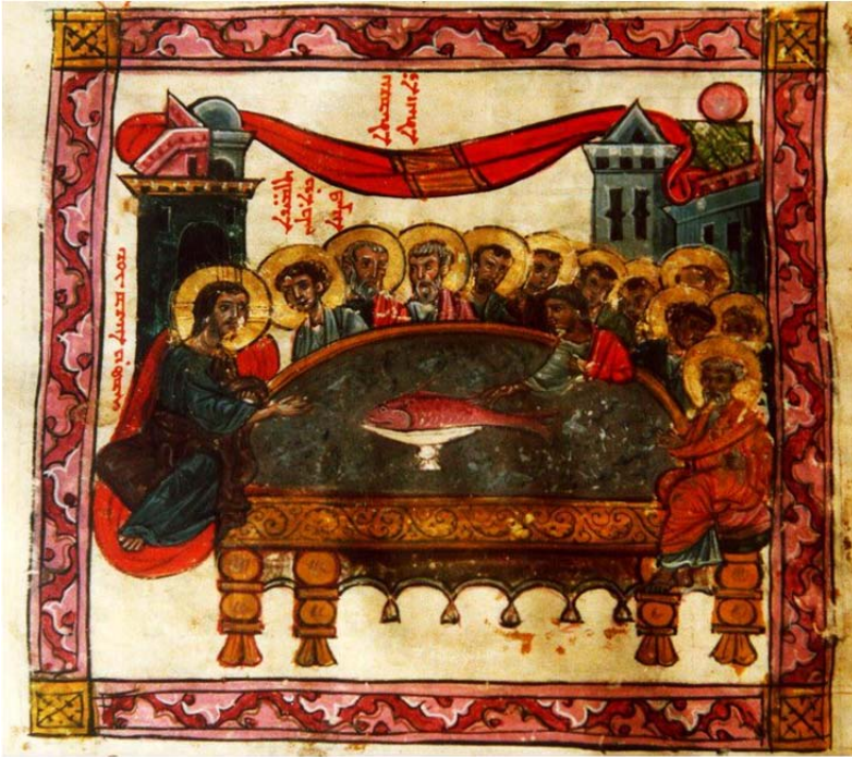
La miniatura proviene dal Monastero Mar Gabriel di Tur Abdin